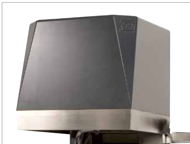
KEN DW 412 er den bedst isolerede opvaskehætte på markedet