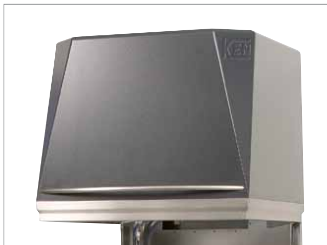
KEN DW 410 er den bedst isolerede opvaskehætte på markedet