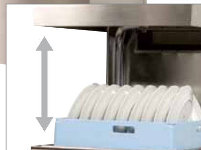
Stor indføringshøjde på 450 mm