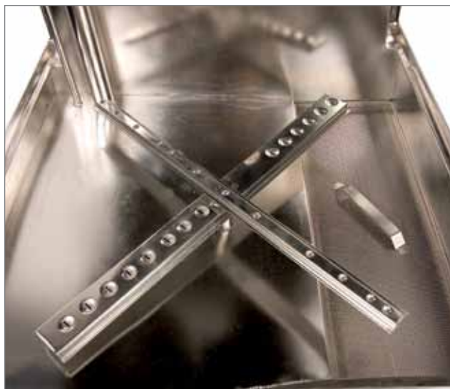
KEN DW 412's nye forbedrede elpolerede vaske- og skyllearme