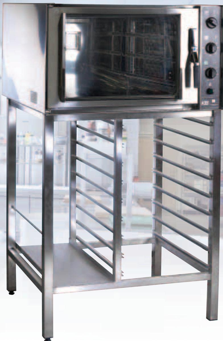
KEN CHEF 24